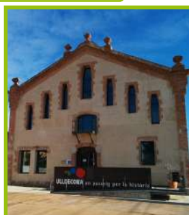
Oficina Turisme: antic molí d'oli.

Ulldecona es el municipio con el mayor número de olivos milenarios del mundo: 1.372, en el 2017. El museo del Arion, donde hace visitas guiadas la oficina de Turismo, está situado junto a la Vía Augusta romana y en él se pueden admirar 35 ejemplares en poco más de una Ha.